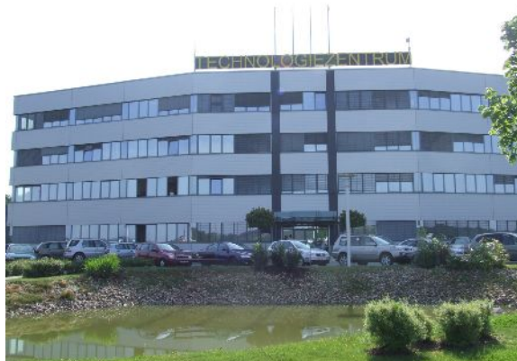
(Technologiezentrum, A-7540 Güssing, Europastr. 1.)